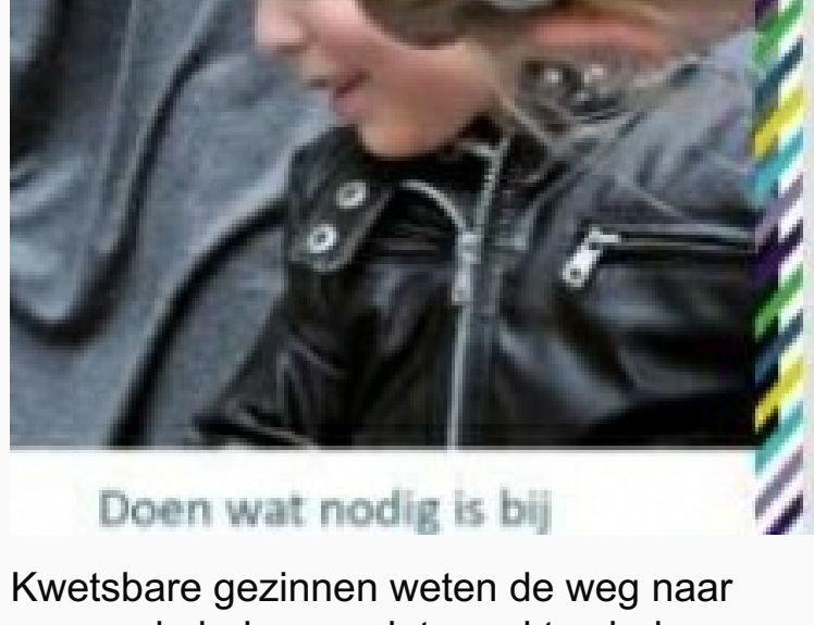
Doen wat nodig is bij

Kwetsbare gezinnen weten de weg naar passende hulp nog niet goed te vinden. Huishoudens met complexe problemen en kindermishandeling, huiselijk of seksueel geweld krijgen vaak niet de hulp waaraan zij behoefte hebben. De zorg is te gefragmenteerd en de veiligheid in deze huishoudens wordt onvoldoende gemonitord. Het Nederlands Jeugdinstituut (Nji) en Movisie deden onderzoek naar de situatie van deze gezinnen.