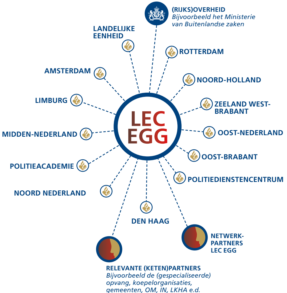
Figuur 1: relatie LEC EGG eenheden en partners (NB: geen hiërarchische volgorde)