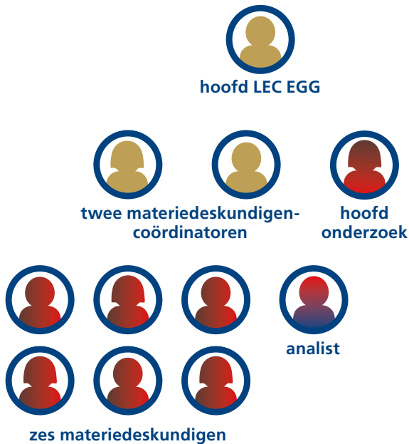
Figuur 3: organisatie LEC EGG