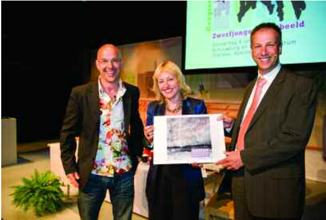
Conferentie 'Zwerfjongeren in beeld'

Een grote groep ex-dakloze jongeren nam deel aan 'Zwerfjongeren in Beeld', een nationaal congres dat de FO organiseerde met een aantal partners. De Filmschool van IrisZorg presenteerde tijdens het programma korte portretten waarin jongeren hun mening gaven over inspraak, participatie en begeleiding. In de Filmschool werken groepen ex-dakloze jongeren aan filmprojecten.